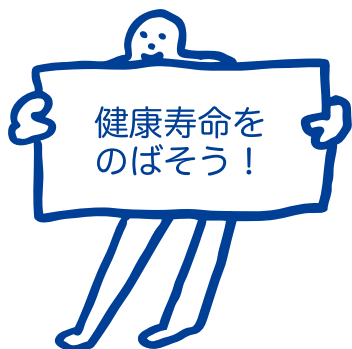
ポーズ5「ボードでアピールA」